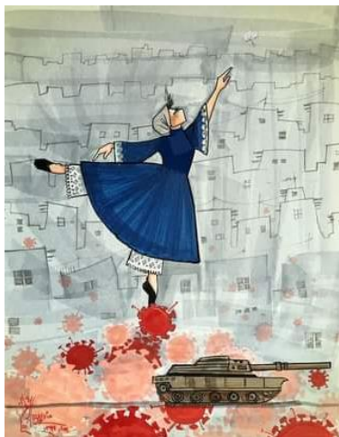
Immagine di Shamsia Hassani

Staffetta dei diritti delle donne afgane