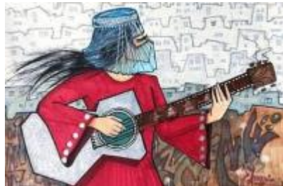
Immagine di Shamsia Hassani

#donneafganelibere #M5S #SenatodellaRepubblica