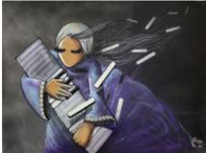
Illustrazione di Shamsia Hassani

Partecipo alla staffetta per le #donneafghane delle parlamentari italiane e lo faccio proprio nei giorni in cui sono chiamata ad esercitare l'espressione massima di democrazia: il voto del Capo dello Stato.