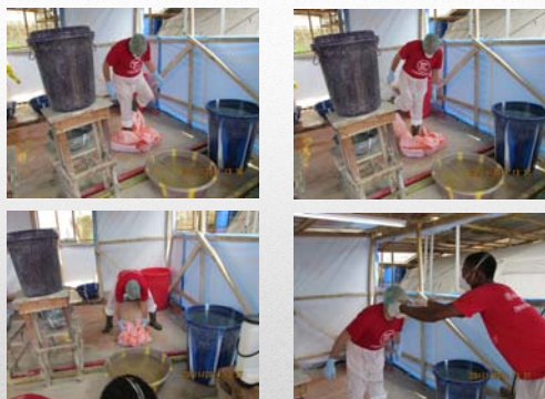
Svestizione – 5