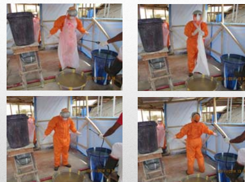
Svestizione - 2