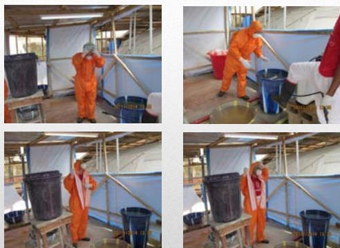
Svestizione – 3