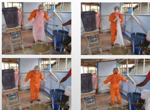
Svestizione - 1