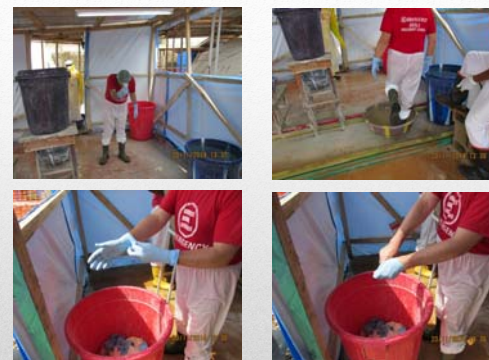
Svestizione – 6