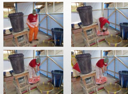
Svestizione – 4