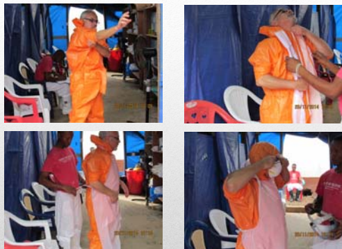
Vestizione - 1