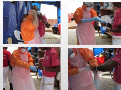
Vestizione - 2