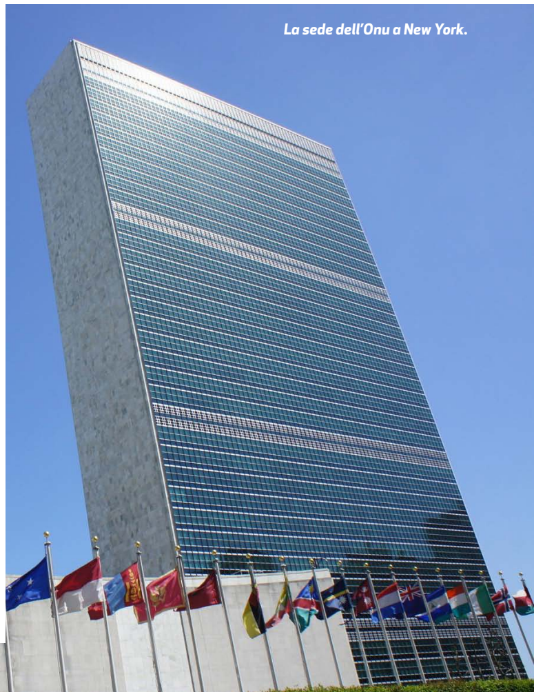
La sede dell'Onu a New York.

radigmatico. Per quanto di specifico interesse nella presente trattazione, rilevano, in particolare, i principi enunciati agli artt. 1 (Tutti gli esseri umani nascono liberi ed eguali in dignità e diritti); 2 (Ad ogni individuo spettano tutti i diritti e tutte le libertà enunciate nella presente Dichiarazione, senza distinzione alcuna, per ragioni di razza, di colore, di sesso, di lingua, di religione, di opinione politica o di altro genere, di origine nazionale o sociale, di ricchezza, di nascita o di altra condizione...); e 3 (Ogni individuo ha diritto alla vita, alla libertà ed alla sicurezza della propria persona).