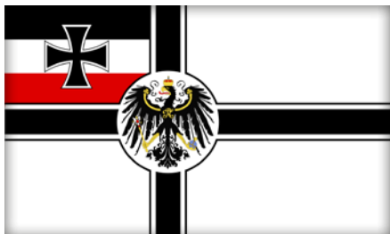
Bandiera del II Reich.

Tenuto conto del fatto che la casistica di simboli d'odio è davvero vastissima, e che obiettivo di questo paragrafo è più che altro quello di stimolare la curiosità personale e l'interesse professionale dell'operatore in materia, per un ricco database di simboli dell'odio (sia pure focalizzato sul contesto statunitense) si rinvia all'interessante sito dell'ONG ebraica USA Anti-Defamation League ( https://www.adl.org/hate-symbols ).