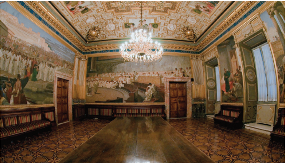
Palazzo Madama, Cortile d'onore e Sala Maccari