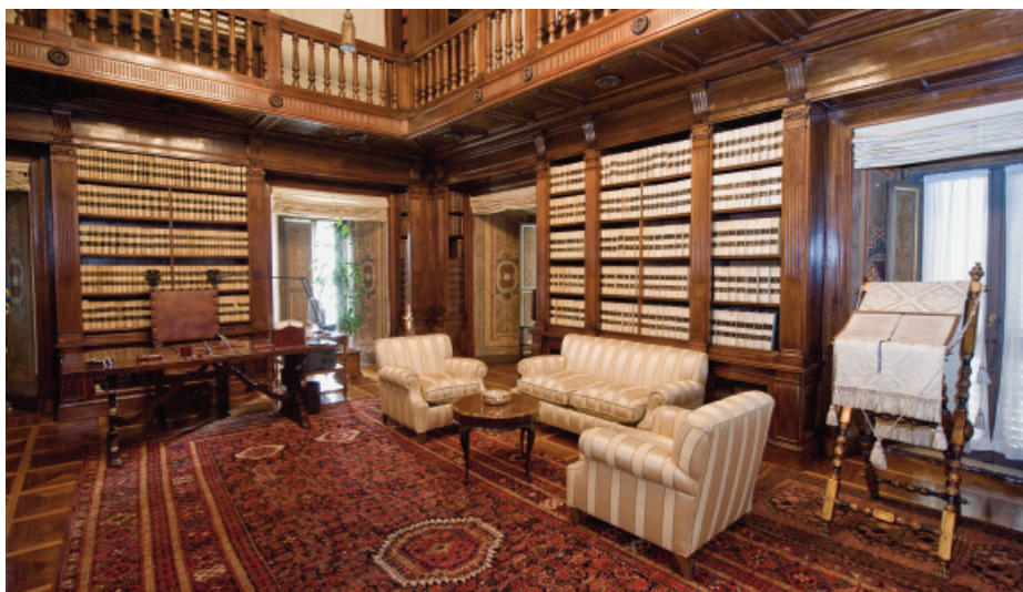
Palazzo Giustiniani, Sala della Costituzione