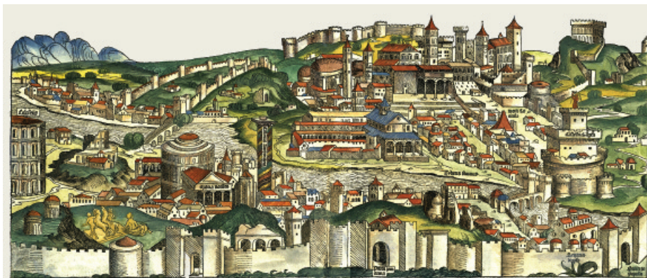
Roma, tratta da: Hartmann Schedel, Liber Chronicarum , Nuremberg 1493