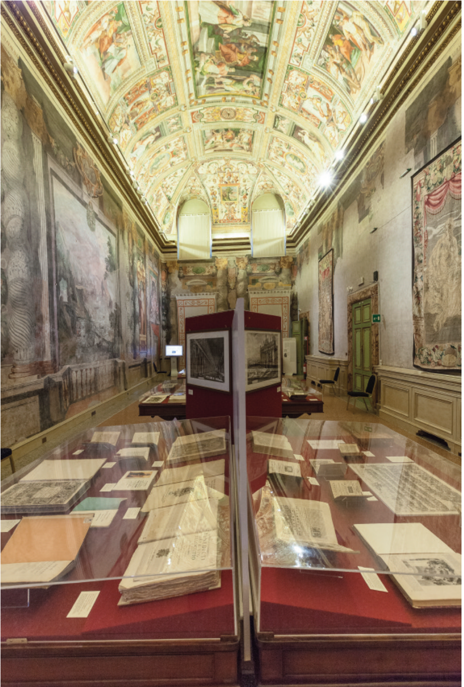
La Sala Zuccari allestita per la mostra Antiquorum habet