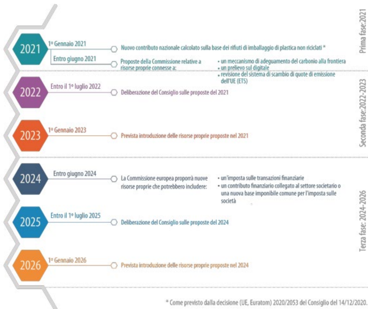
Figura 1 - Tabella di marcia per l'introduzione di nuove risorse proprie