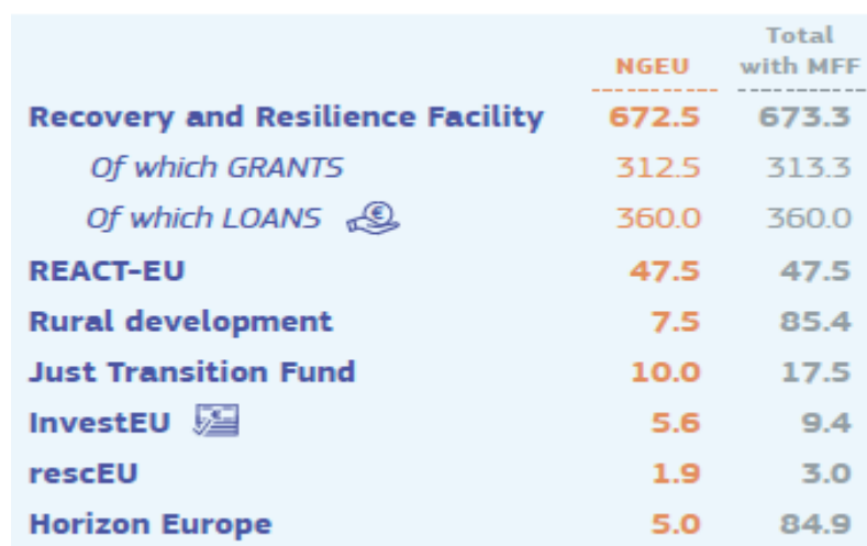
Tabella 2 - Prospetto delle risorse allocate ai programmi NGEU.